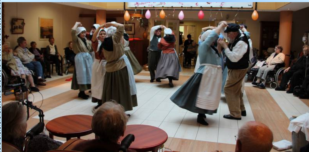
A l'EHPAD Patrice Groff 18/02/2015

Notre « contredanse polka » de Bastogne utilise la formation en quadrette, c'est à dire à 4 danseurs, 2 couples face à face. Ses figures (couplets) sont : le rond, la chaîne des dames, les ponts, les dos à dos, les saluts. La danse commence par le refrain qui se retrouve entre chaque figure : un aller-retour en pas de côté vers le centre suivi d'un rond sens des aiguilles d'une montre puis aller-retour en pas de côté vers le centre suivi d'un rond dans le sens contraire des aiguilles d'une montre. Tout cela en pas de polka ... sans arrêter le pas de polka même quand on reste sur place !